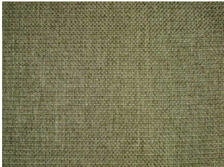
ILUSTRAČNÍ OBRÁZKY VHODNÝCH TEXTÍLÍ