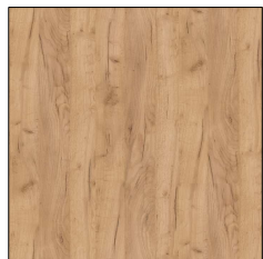
VRCHNÍ DESKY STOLŮ, ČELA ZÁSUVK, ODKLÁDACÍ STĚNY