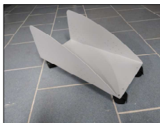
VPC - VOZÍK NA POČÍTAČ