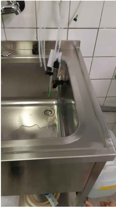
DETAIL PROVEDENÍ HRAN A LEMŮ