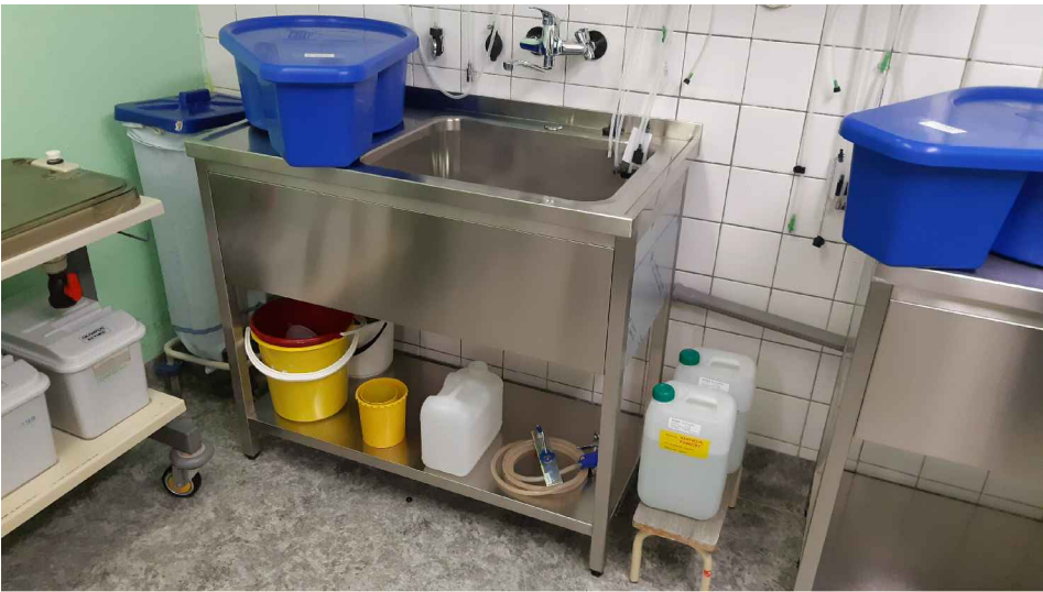
STÁVAJÍCÍ MYCÍ STŮL ST 01

U vestavěného a na stavbu navazujícího nábytku je nutné před jeho výrobou zaměřit skutečné rozměry stavebních konstrukcí !!