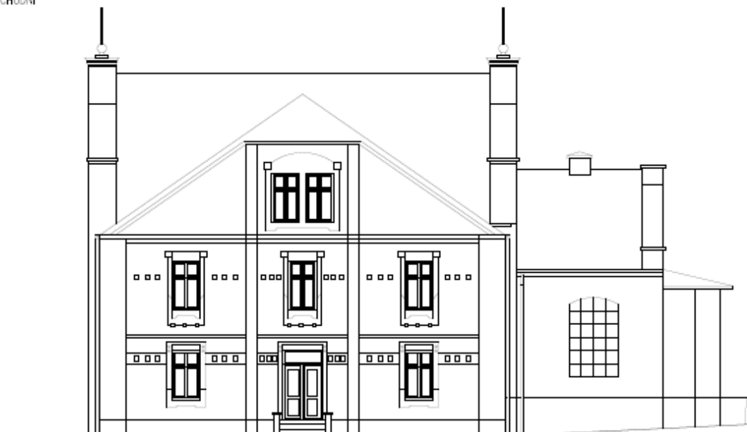
Východní fasáda – pohled