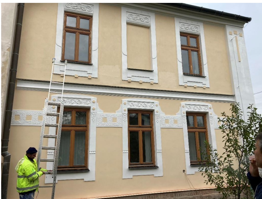
Pohled na stávající jižní fasádu po opravě (okna bez nátěru) - foto