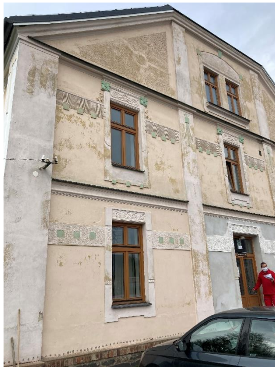
Pohled na stávající východní fasádu - foto