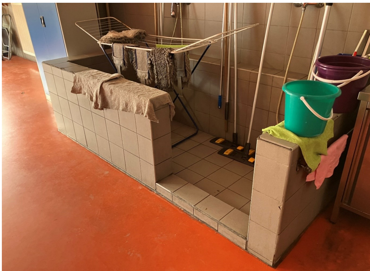
4 - Desinfekční kout