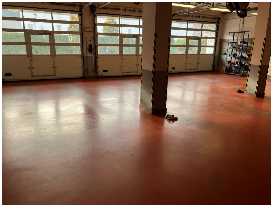
1 - Garáže sanitek

Hygienický kout v prostorách garáže slouží k základní očiště použitých zdravotnických pomůcek a nástrojů. Kout je obezděná a keramickým obkladem obložená konstrukce s přívodem vody a vlastním odvodněním. Hygienický kout je morálně i technicky zastaralý je nutná jeho kompletní obnova.