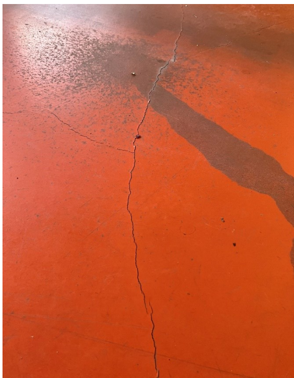
2 - Trhliny v ploše podlahy