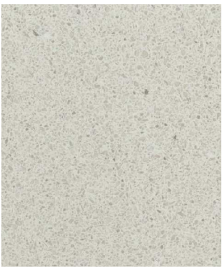
ILUST. FOTO DEKORU PRAC.DESKY

POZN.: HORNÍ SKŘÍŇIKY ZAVĚSIT NA OCELOVÉ KOTVY DO ZDI, KOTVY LEPIT DO ZDI NA CHEMICKÉ KOTVY HILTI, DO OBKLADU STĚNY NUTNO PROVĚST OTVORY PRO EL. ZÁSUVKY A VYPÍNAČE