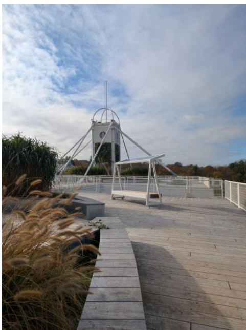
LAVIČKA BEZ OPĚRADLA