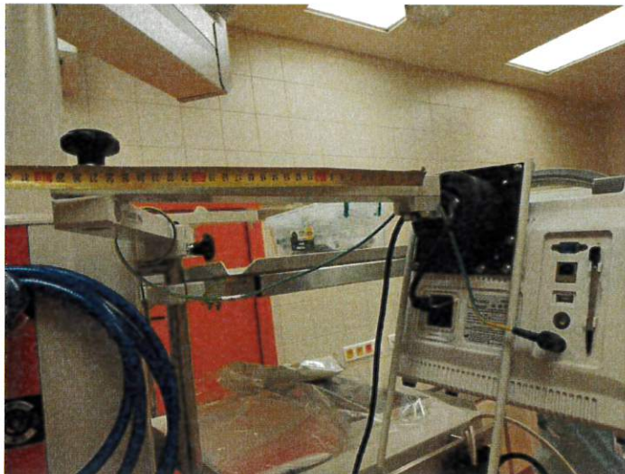
Držák na 2 endoskopy (uchycení na eurolištu): 2 endoskopy (např. BF 190)