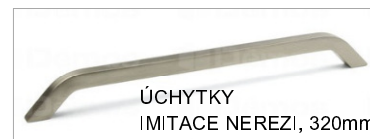
ÚCHYTKY IMITACE NEREZI, 320mm